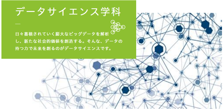
横浜市立大学 データサイエンス学部

医療、福祉、ものづくり、 データサイエンスなど 21世紀に欠かせない人材を育成。