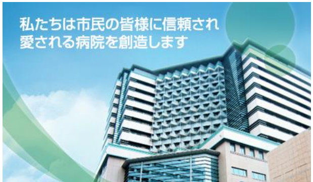
横浜市立大学 市民総合医療センター

地域医療の最後の砦、 地方創生の拠点、 地域イノベーションの創出など 未来に向けた政策を実施。