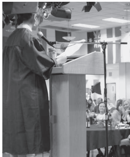
タコマ・コミュニティカレッジでの修了式