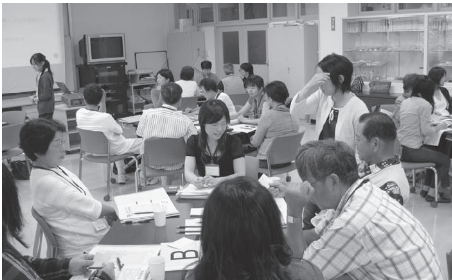
社会人キャリアアップ研修風景

本学は68年にわたり県民に愛され支えられた地域大学である。平成18年、厳しい大学間競争を勝ち抜き、さらなる存在感を示すことを目的として独立行政法人化を果たした。自主的、自立的な大学運営に向けて、教育を重視する大学(育てる)、学生を大切にする大学(支える)、地域に密着した研究を推進する大学(究める)、地域に開かれた大学(ともに学ぶ)、地域と世界をつなぐ大学(結ぶ)を理念とし、一同一体となって「大学改革」を達成すべく、法人化後6年間に201項目の中期計画を立てた。その達成に日夜精進し、地域社会や住民から信用され、即戦力となる人に優しい人材育成に益々の発展が期待されている大学である。