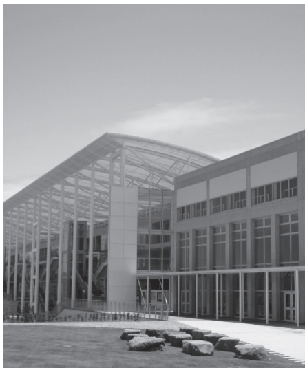
ひびきのキャンパス