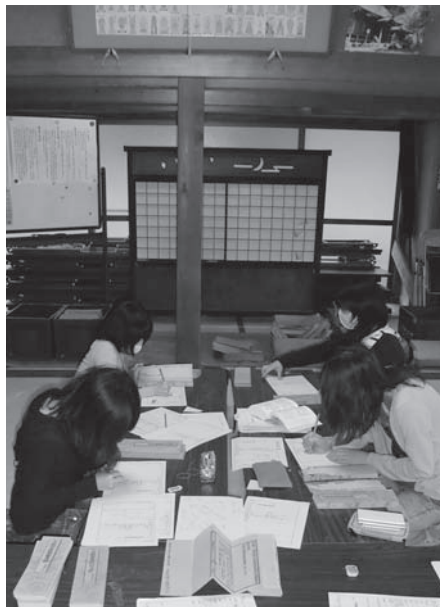
普門寺(豊橋市)における古文書調査