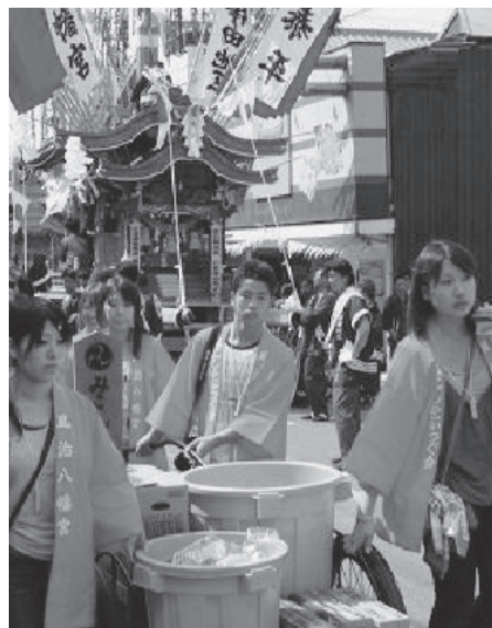
地域最大のまつり・神幸祭のゴミ回収学生ボランティア

産学官民連携・協働による研究・事業等の推進は、附属研究所やワーキンググループにより、地域貢献、教育GPの申請などで取組んでいる。大型委託費以外の取組テーマは「シーズ連携・マザークラス」「福祉用具の開