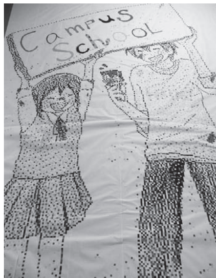
不登校・ひきこもりキャンパススクールの子ども作成の絵