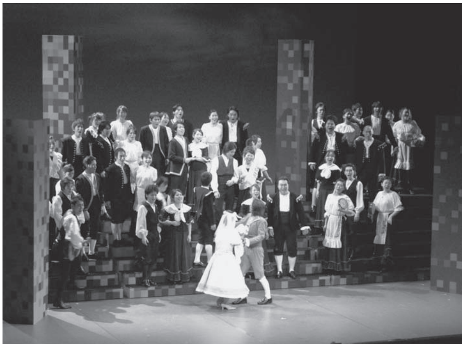
大学院オペラ公演：長久手町文化の家