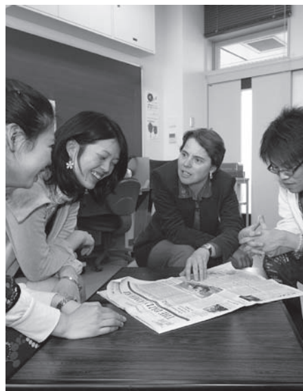
ネイティブ・スピーカーの教員と学生