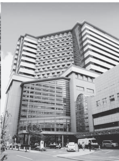
左上 附属病院 上 附属市民総合医療センター 左 プラクティカル・イングリッシュの様子