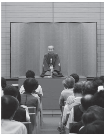
「大阪落語への招待」の授業風景