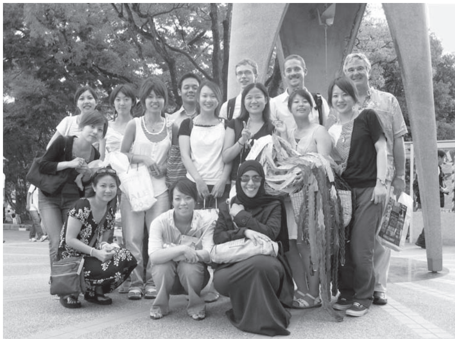
HIROSHIMA and PEACE 受講者（平和記念公園原爆の子の像前）

学部：国際学部、情報科学部、芸術学部 研究科：国際学研究科、情報科学研究科、芸術学研究科 本部所在地：〒731-3194 広島市安佐南区大塚東3-4-1 交通：広島バスセンターからバス 13分 TEL：082-830-1500 FAX：082-830-1656 設立年：1994年 設置者：広島市（2010年度から公立大学法人広島市立大学（広島市）） 学生数：2,064名 教員数：200名 職員数：44名