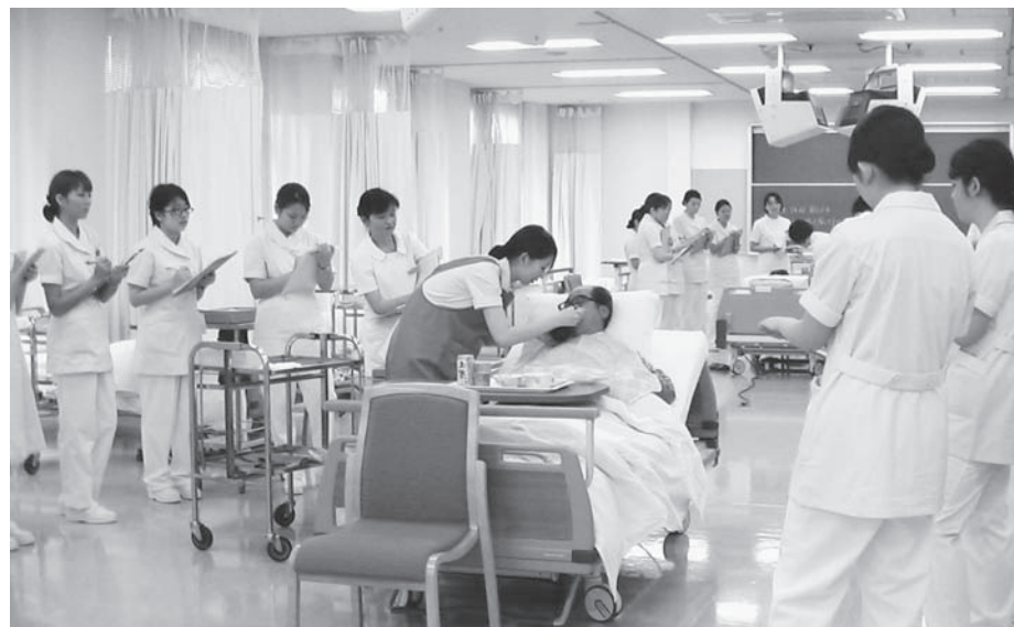
地域住民による教育ボランティアを導入したカリキュラム

現代GPは平成18年度から20年度の事業として実施し、一応の区切りを迎えたことになりましたが、地域住民からの事業継続の要望が強く、また、学生への教育保障・カリキュラム継続の必要性からも、21年度には「健康支援地域連携センター」を学内組織として立上げ、さらなる事業の発展を図ることにし、現在に至っています。