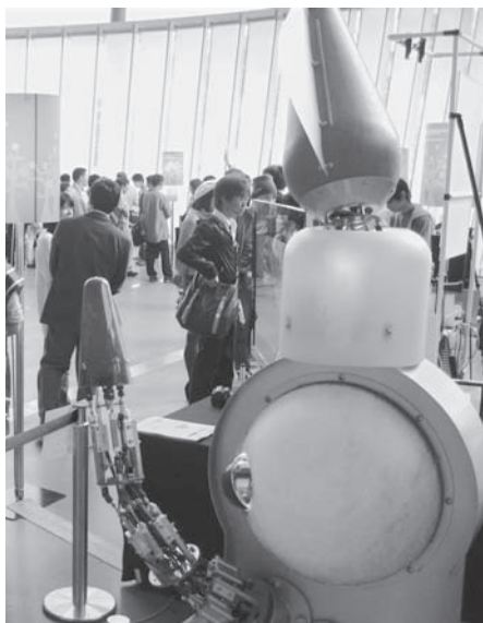
IKABO のデモ（日本科学未来館）

「いか踊り」を踊るイカロボットの開発が始まったのは、2005年のことである。市民の有志から、函館の観光シンボルとなるロボットが作れないかという相談が、未来大学に持ち込まれた。地元最大の祭りである港祭りの呼びものは、「いか踊り」のパレード。これを踊るロボットを開発することが決まった。産官学連携の