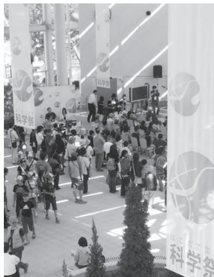
はこだて国際科学祭（五稜郭タワー）

「科学を文化に」を合言葉に企画された「はこだて国際科学祭」は、未来大学からの呼びかけに応じて地域の連携が形成された例だと言えよう。未来大学開校10年目および函館開港150周年とも連動して2009年8月に開催された国際科学祭は、9日間の会期中、71イベントに合計8,500人