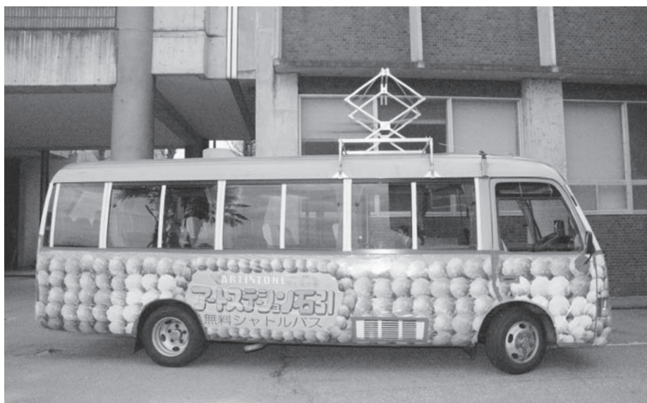
花バスでまちなかににぎわいを再現