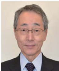
学長：霜鳥秋則 SHIMOTORI Akinori 教育行政、憲法 任期：2015.4～2019.3