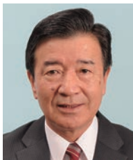
学長：清水一彦 SHIMIZU Kazuhiko 教育学 任期：2015.4～2019.3