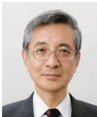
学長：猪口 孝 INOUCHI Takashi