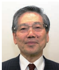
学長：進士五十八 SHINJI Isoya

「恐竜学研究所」は、恐竜化石産出量日本一を誇る福井県の恐竜学研究所の拠点となる研究所で、国内外の機関と連携して恐竜学研究活動の学術レベルの向上を図るとともに、「恐竜学」「地球生命史学」などの科目を開講して学生に恐竜の魅力を教えています。