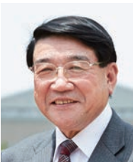
学長：清原正義 KIYOHARA Masayoshi 教育行政学 任期：2013.4～2017.3