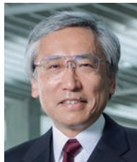
学長：片桐恭弘 KATAGIRI Yasuhiro