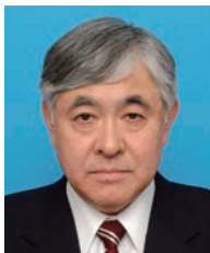
学長：前田邦彦 MAEDA Kunihiko 医学 任期：2016.4～2020.3

学生全員が保健医療に関わる国家資格を取得し、卒業後は山形県内をはじめ、全国的に病院や施設等の現場で活躍しており、就職率は毎年ほぼ 100%を維持しています。