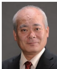
学長：荒川哲男 ARAKAWA Tetsuo