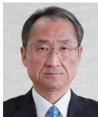
学長：船山仲他 FUNAYAMA Chuta 言語学、通訳理論 任期：2015.4～2017.3

「模擬国連世界大会」を日本で初めて11月に開催します。世界中から学生が集まり、実際の国連と同様の議論を全て英語で行います。熱い討議や、日本文化・歴史の発信が行われる国際交流の機会です。