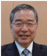
学長：三浦彦彦 MIURA Yoshihiko 疫学、保健統計 任期：2015.4～2017.3