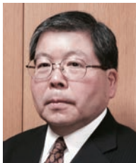
学長：川田誠一 KAWATA Seiichi 制御工学、サービス科学 任期：2016.4～2020.3