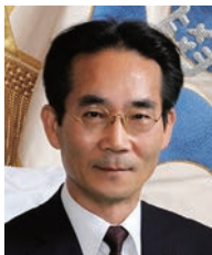
学長：濱口富士雄 HAMAGUCHI Fujio