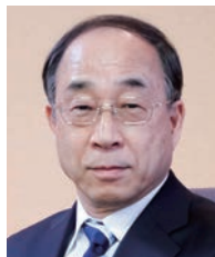
学長：佐古和廣 SAKO Kazuhiro 医学（脳神経外科学） 任期：2016.4～2020.3