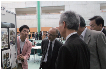
日頃の間取りを直接アピールしたポスターセッション

午後は、3 会場に分かれテーマ別の委員会に参加した後、特別シンポジウムで学生と合同セッション。学生からの「なぜ公立大学は地域を向かなくてはいけないのか」との質問に、「地域から題材をもらいながら教育や研究を行い、どの地域でも応用できる成果を残すのが本当の地域貢献だと考えている」等の意見が学長から聞かれるなど、活気にあふれた時間となりました。