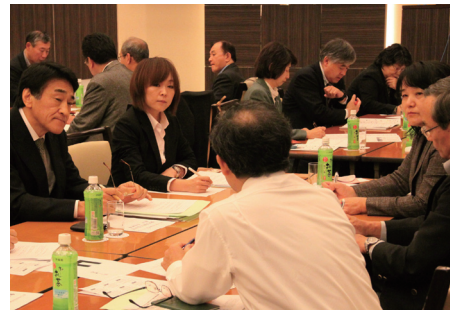
グループディスカッションを実施（第 3 回）