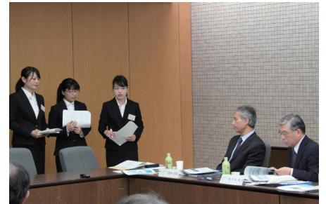
学生との活発な議論（長崎県立大学）

後日、訪問チームは、当日の議論の概要やチームからの提言を付した外部評価報告書「大学ピアレビュー」をまとめ、大学側に提供しました。