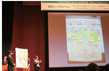
学生の投票により選ばれた 4 組が堂々と壇上で発表