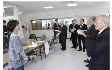
学生相互による学修支援活動の様子（名桜大学）