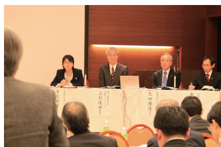
第3回高等教育改革フォーラムパネルディスカッション