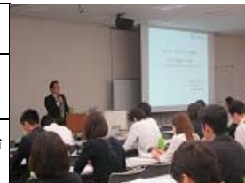
大阪会場で、公立大学職員等に向けて講演する伊藤忠通奈良県立大学長。