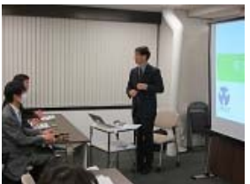
第1回勉強会の様子。協会事務局において開催。