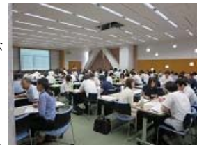
グループワークに取り組む公立大学職員。