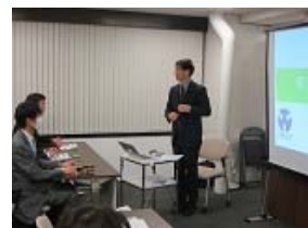
第1回勉強会の様子。協会事務局において開催。