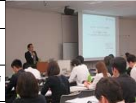
大阪会場で、公立大学職員等に向けて講演する伊藤忠通奈良県立大学長。