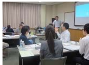
公立大学職員が企画したスキルアップ研修会の様子。職員の視点から4つのテーマを設定。