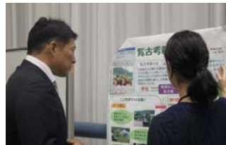
ポスターセッションでは、樋口尚也文部科学政務官が熱心に学生の発表に耳を傾けた(上)。