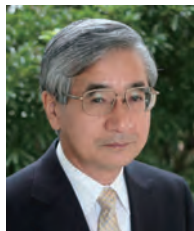
学長：古賀 実 KOGA Minoru