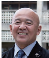
学長：佐久本嗣男 SAKUMOTO Tsuguo 空手・古武道 任期：2010.7～2014.7

音楽学部では、2014年度の学部創設25年を契機に、2019年度までの6年間、県内外諸機関と連携し教職員・学生が一体となって教育研究・地域活動を推進するプロジェクト「OMPRO 天川原の綾虹」を展開する。