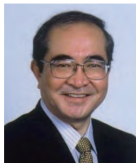
学長:原島文雄 HARASHIMA Fumio パワーエレクトロニクス、ロボット工学 任期:2013.4~2015.3

英国の教育専門誌「TIMES」における2013年発表の「世界大学ランキング」で、本学は引用論文部門で米マサチューセッツ工科大学とともに最高点の100.0ポイントを得ております。また、総合では国内6位にランキングされ、本学が国際的にも評価されていることを示すものといえます。