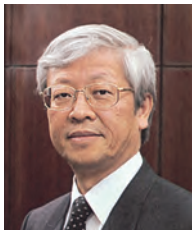
学長：石島辰太郎 ISHIJIMA Shintaro 計測制御工学、教育工学 任期：2014.4～2016.3