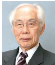
学長：難波正義 NAMBA Masayoshi 医学 任期：2012.4～2016.3