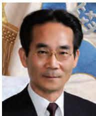
学長：濱口富士雄 HAMAGUCHI Fujio