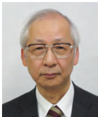
学長：石川弘道 ISHIKAWA Hiromichi 経営情報システム 任期：2013.4～2017.3