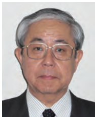
学長：青柳 優 AOYAGI Masaru 医学(耳鼻咽喉科学) 任期：2012.4～2016.3

学生全員が保健医療に関わる国家資格を取得し、卒業後は山形県内をはじめ、全国的に病院や施設等の現場で活躍しており、就職率は毎年ほぼ 100%を維持しています。