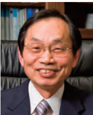
学長：奥野武俊 OKUNO Taketoshi 船舶海洋工学 任期：2013.4～2015.3