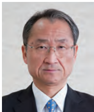
学長：船山仲他 FUNAYAMA Chuta 言語学、通訳理論 任期：2011.4～2015.3