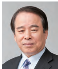
学長：木苗直秀 KINAE Naohide 食品衛生学、安全解析学 任期：2013.4～2015.3