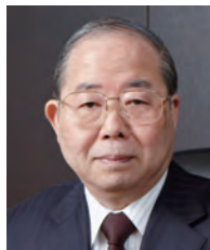
学長：小間 篤 KOMA Atsushi