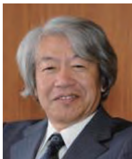
学長：福田誠治 FUKUTA Seiji 教育哲学 任期：2014.4～2018.3

2014年度に、返済が不要な「給付型奨学金」を創設しました。成績優秀な学生を対象とする「成績優秀者奨学金」、留学を支援する「グローバル教育奨学金」、他大学でもあまり例をみない「遊学奨励金」で意欲ある学生を後押しします。