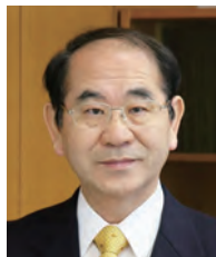
学長：大田啓一 OHTA Keiichi 環境化学 任期：2012.4～2015.3

第2期中期計画のスタートとともに、教育の質保証・向上に向けて、3つの方針(入学受入、教育課程編成・実施、学位授与)を明確にし、シラバスの充実やルーブリックの作成に重点的に取り組んでいます。