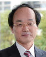
学長：郡 健二郎 KOHRI Kenjiro 泌尿器科学 任期：2014.4～2018.3