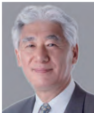
学長：熊倉功夫 KUMAKURA Isao 日本文化史、茶道史 任期：2014.4～2016.3

社会が求める総合化又は多様化するデザイン力の涵養を図るため、2015年4月にデザイン学部3学科(生産造形学科、メディア造形学科、空間造形学科)を1学科(デザイン学科)5領域に再編します。