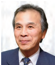
学長：島本和明 SHIMAMOTO Kazuaki 循環器学、高血圧学、内科学 任期：2014.4～2016.3