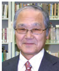
学長：吉津直樹 YOSHIZU Naoki