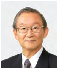
学長：山浦 晶 YAMAURA Akira 医学（脳神経外科学） 任期：2013.4～2015.3