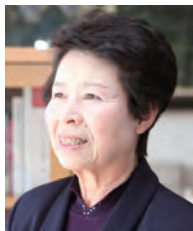
学長：瀬口チホ SEGUCHI Chiho