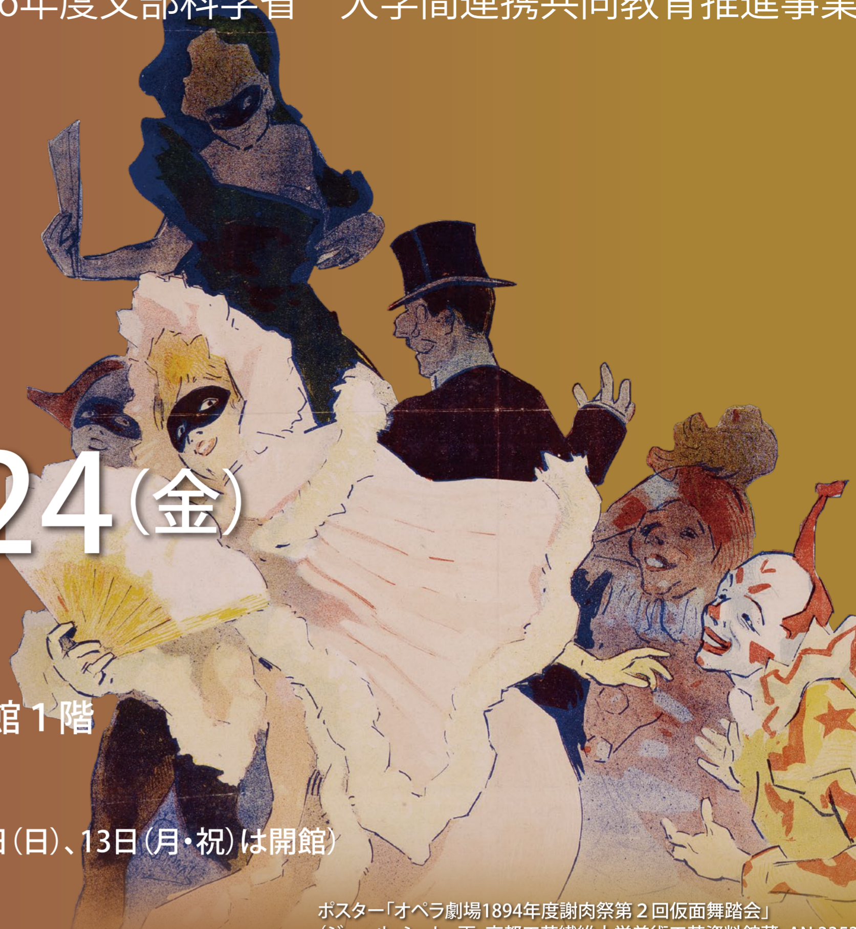
ポスター「オペラ劇場1894年度謝肉祭第2回仮面舞踏会」 (ジュール・シェレ・画、京都工芸繊維大学美術工芸資料館蔵・AN.3353)