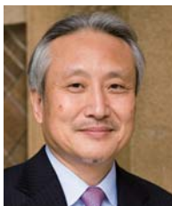
学長：竹中 洋 TAKENAKA Hiroshi