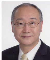
学長：廣川能嗣 HIROKAWA Yoshitsugu 工学 任期：2017.4～2021.3

SDGs (Sustainable Development Goals: 持続可能な開発目標) は、2015年9月の国連サミットで採択された国際目標です。