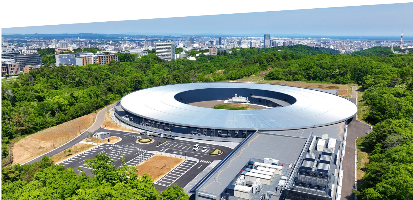
ナノテラス全景(2024年4月運用開始予定・仙台駅から地下鉄で9分)